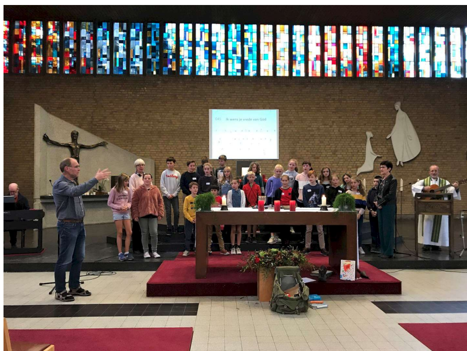
Tijdens de viering zongen we samen: "Ik wens je vrede van God"