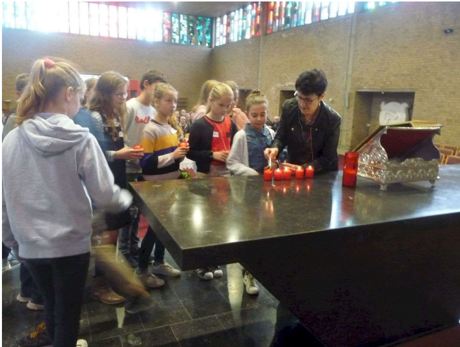
Elke vormeling plaatste zijn lichtje op het altaar