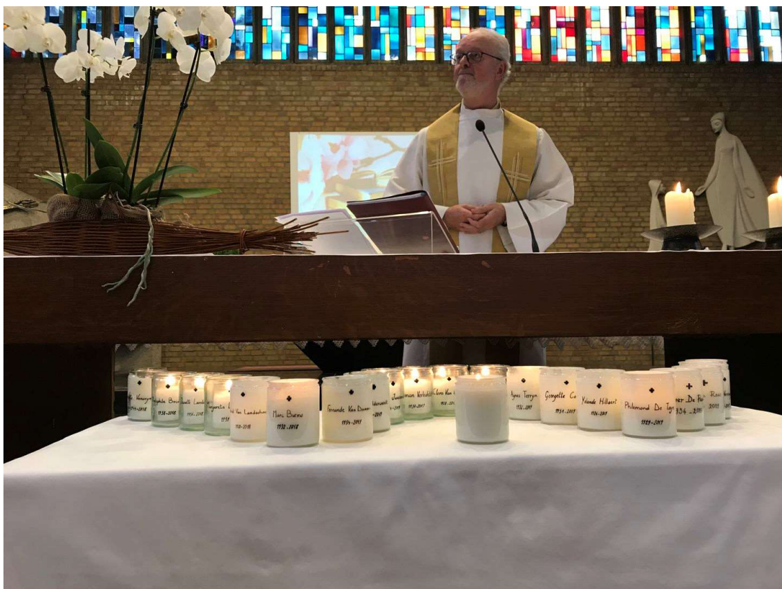
Elke familie nam op het einde van de dienst het kaarsje mee van hun overledene, het krijgt vast een mooi plaatsje in een warme thuis.