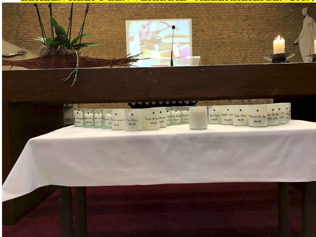
De kaarsjes met de namen van de overledenen staan klaar voor het altaar.