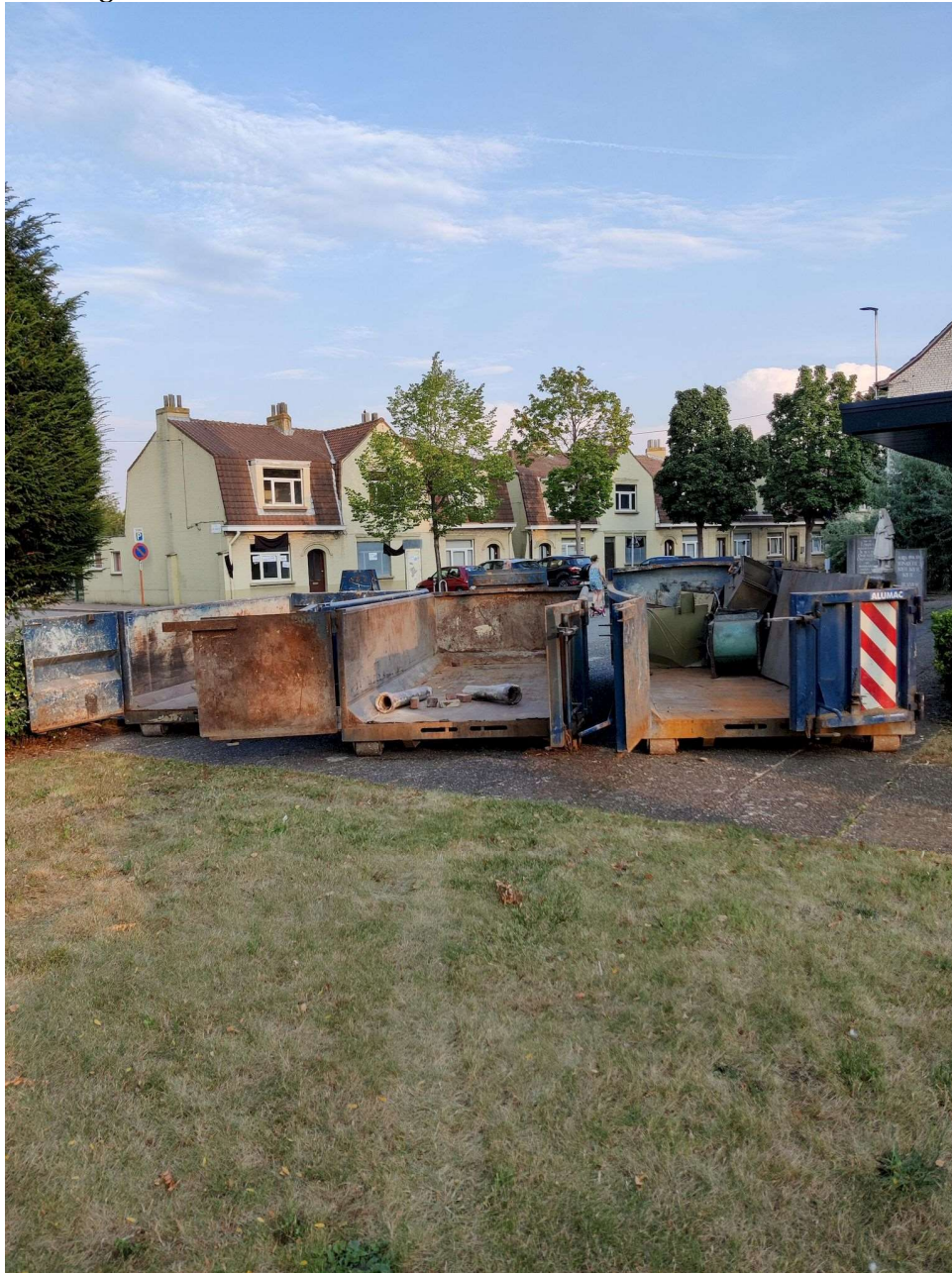
Drie containers broederlijk naast elkaar.