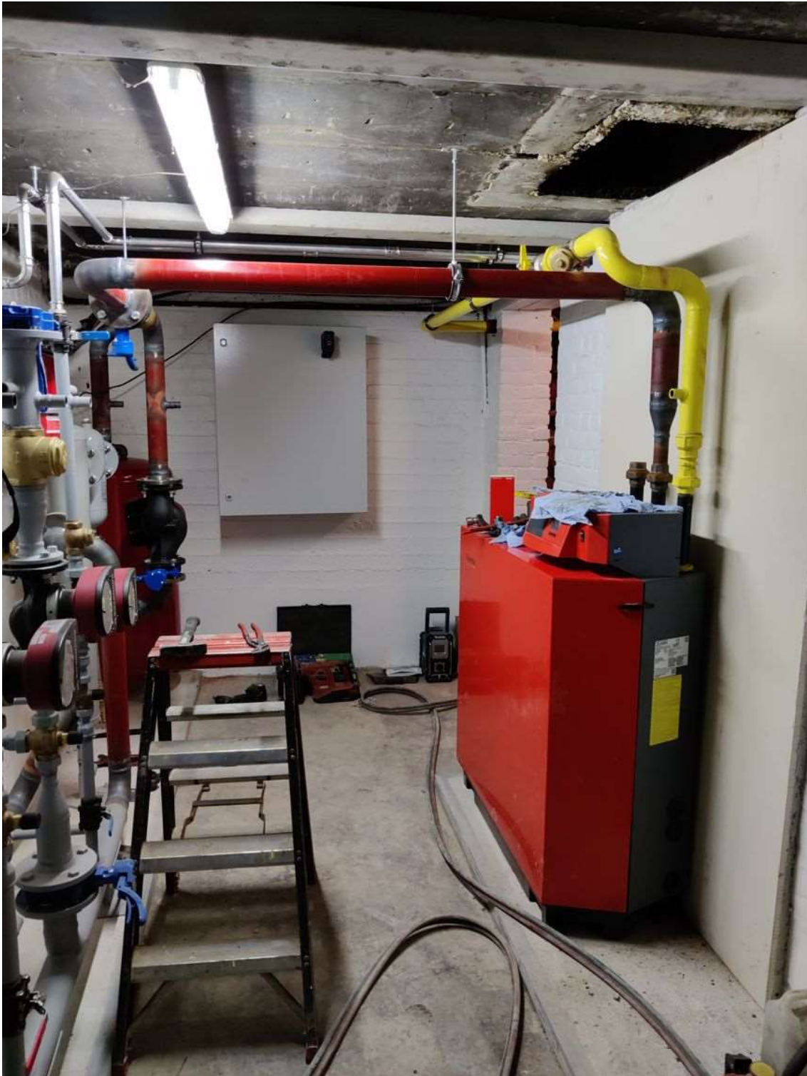
Buizen, kranen, aansluitingen; en nu hopen dat alles goed past en het snel warm wordt.