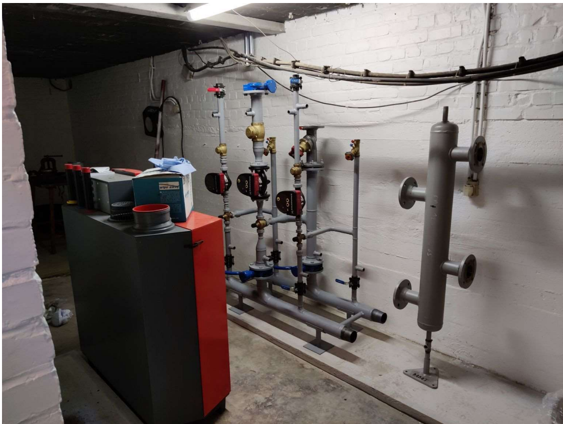
In de kelder vorderen de werken, de ketel staat er al. Op naar warmere tijden!