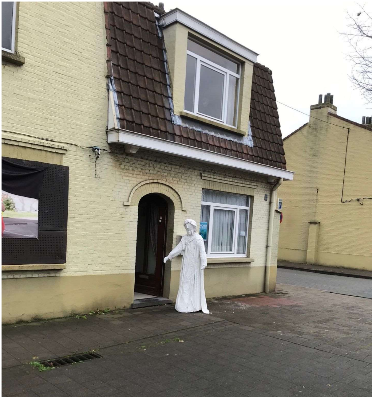
Gelukkig wordt er open gedaan