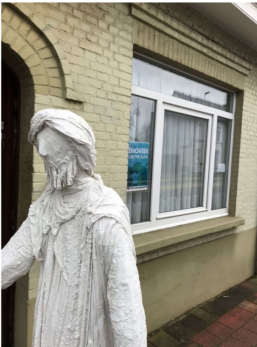
Vele mensen in de buurt zijn ook ongerust; waar is er plaats voor ons?