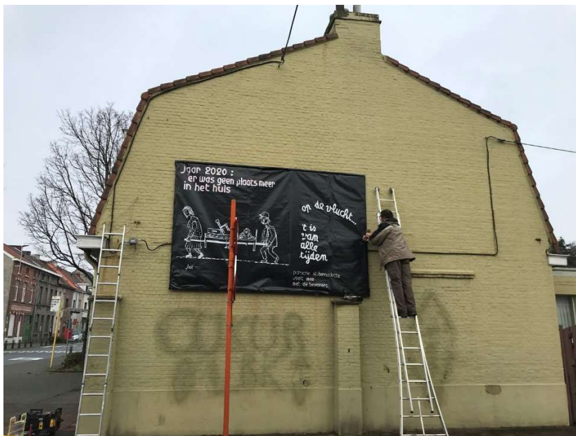
Het spandoek met onze boodschap hangt op in de Sint-Bernadettewijk