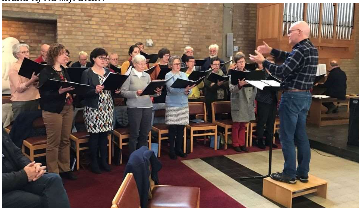
Weldra terug zingen tijdens de vieringen?

Maar deze keer mag ik u schrijven dat we eindelijk goed nieuws hebben! Er is licht aan het einde van de tunnel! Ik zie de zon al een beetje verschijnen. Zou het waar zijn? Mogen we echt opnieuw weer samen vieren? Mogen we ook met Samana stilletjesaan weer samen komen bij een tasje koffie?