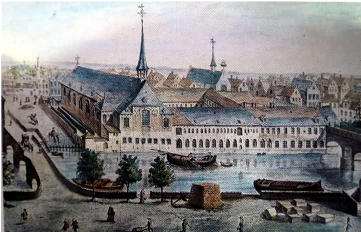
wandtapijt poverello Brugge