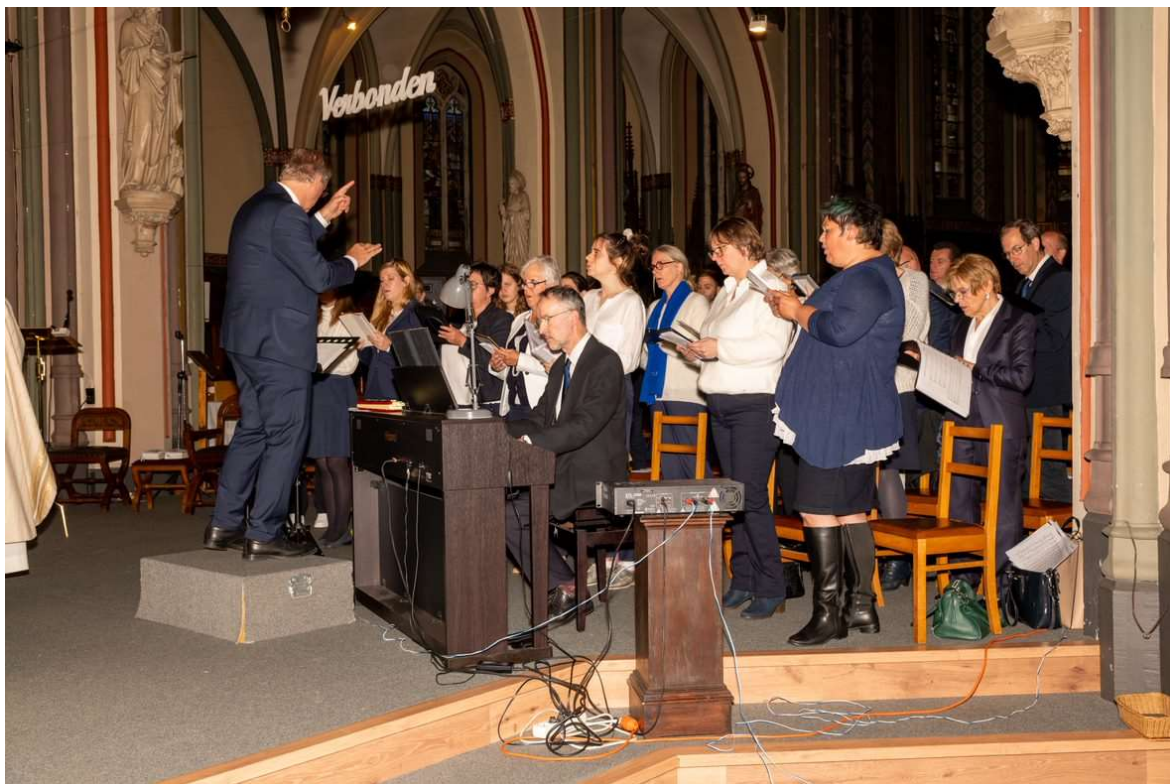
Het livinuskoor