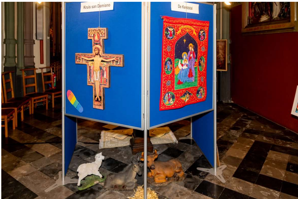
tentoonstelling - © Jan J. Holvoet