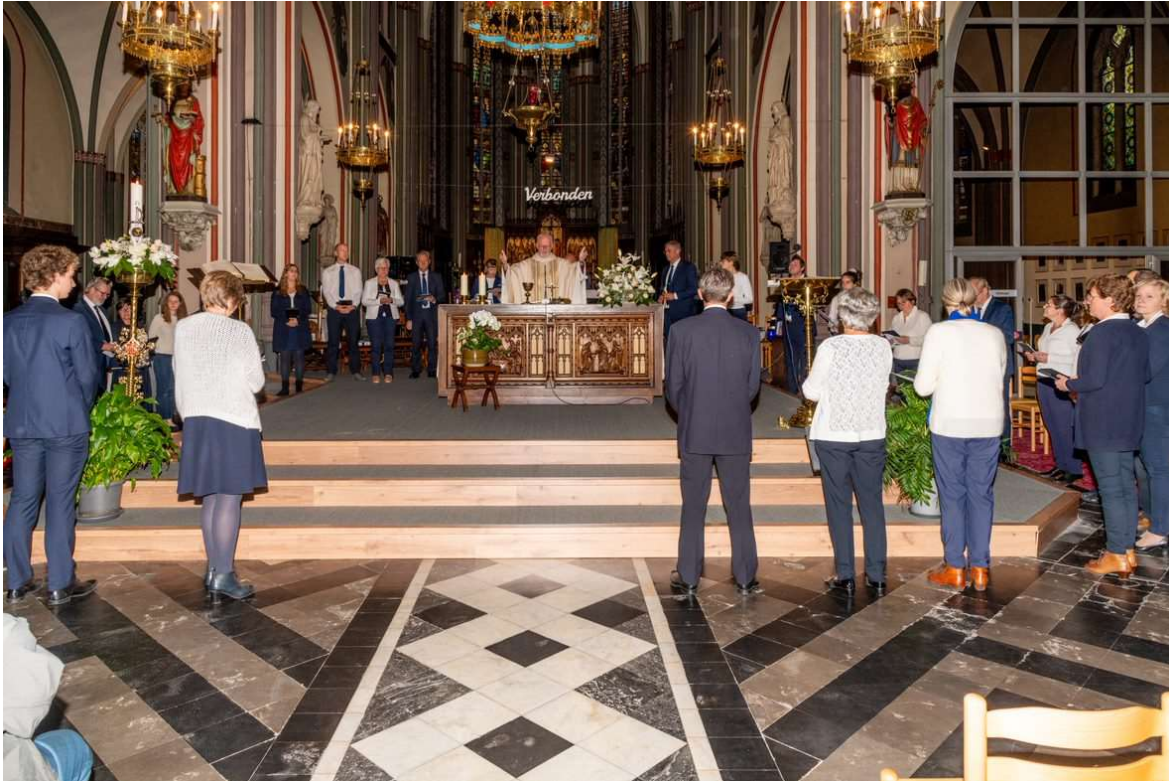
'Hymn of praise' klonk hemels rond het altaar.