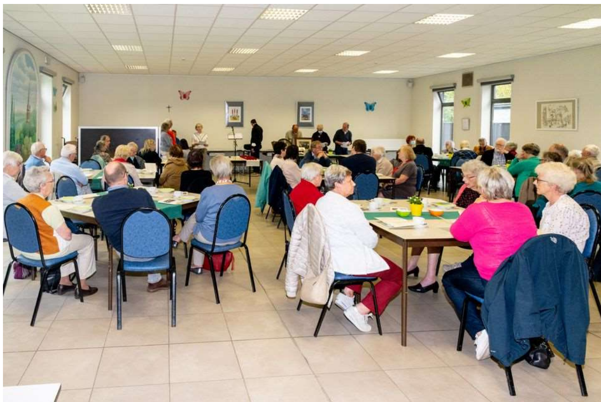
families deelden herinneringen met elkaar