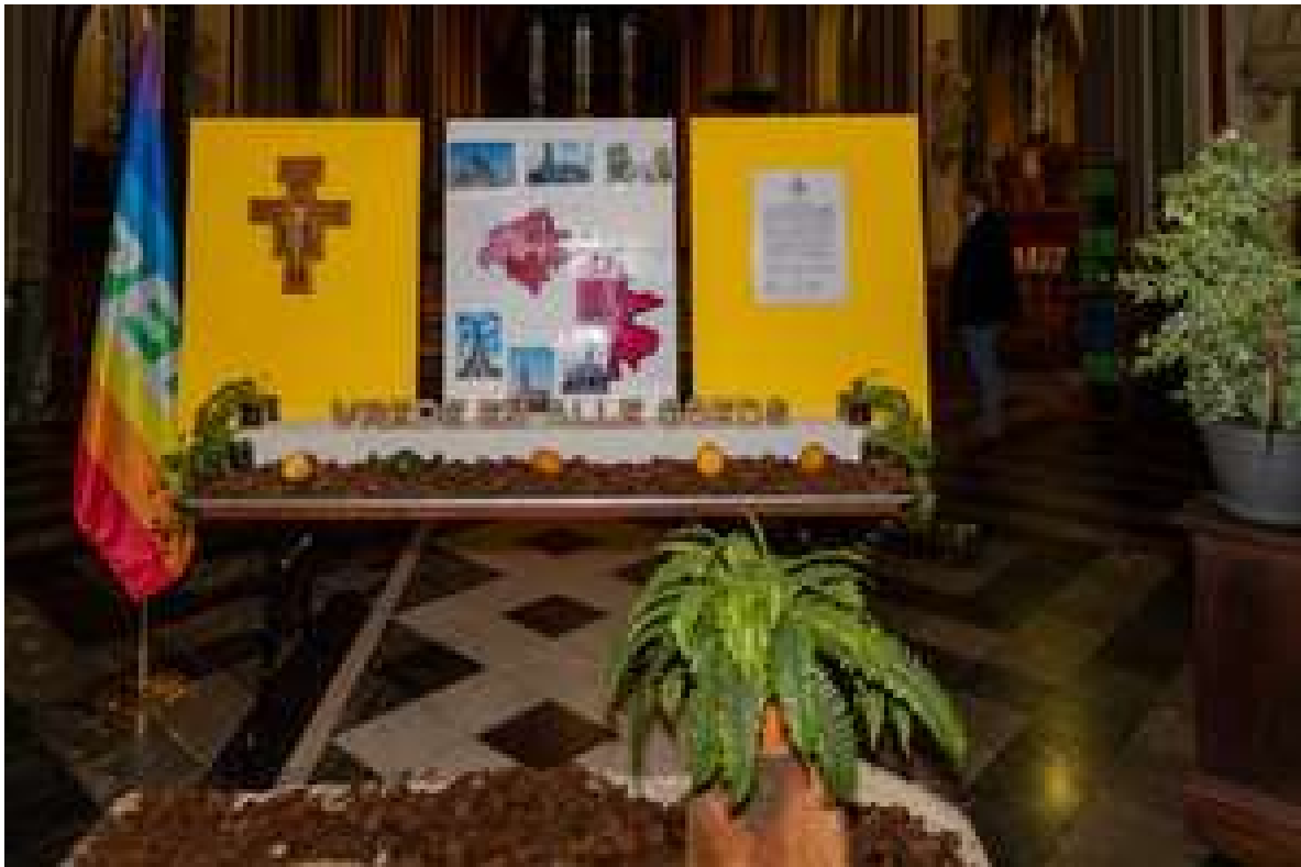
Met 'vrede en alle goeds' startte de tentoonstelling