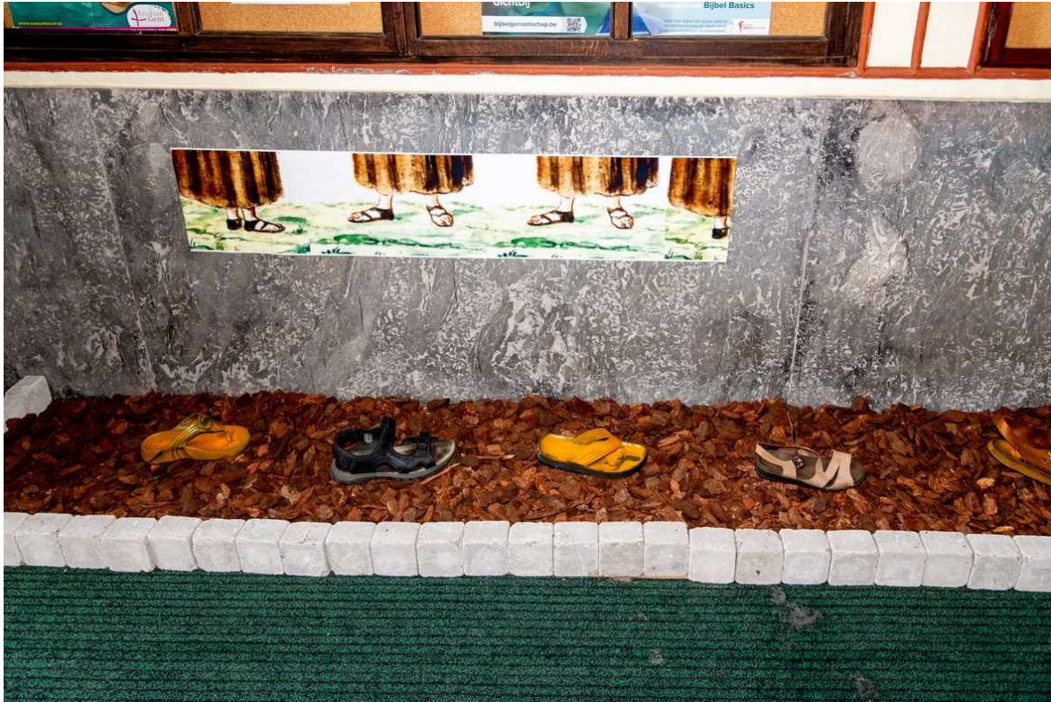
Sandalen wijzen de weg naar de ingang - © Jan J. Holvoet