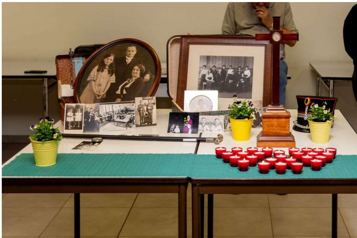
een koffer vol herinneringen