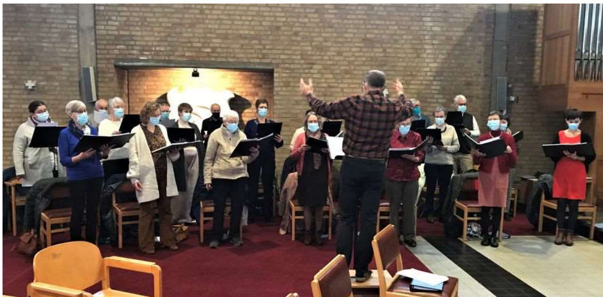
Zelfs met mondmasker brengen de koorleden de mooiste gezangen