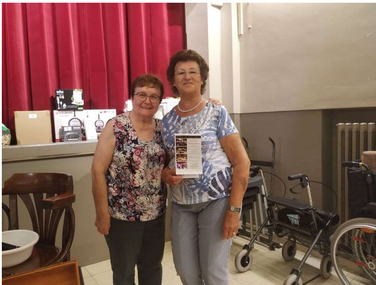
De winnares van het etentje in de lage Vuurse