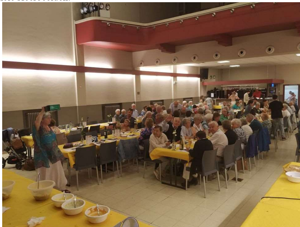
De grote zaal in de Nova was goed gevuld en er werd smakelijk gegeten.