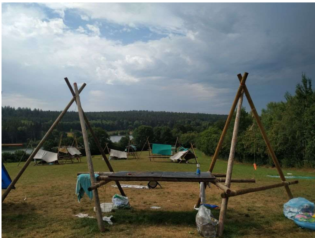
Op dit mooie terrein verbleven de scouts van Bernadette, met zicht op het meer van Butgenbach. Het werd een warm, mooi kamp.