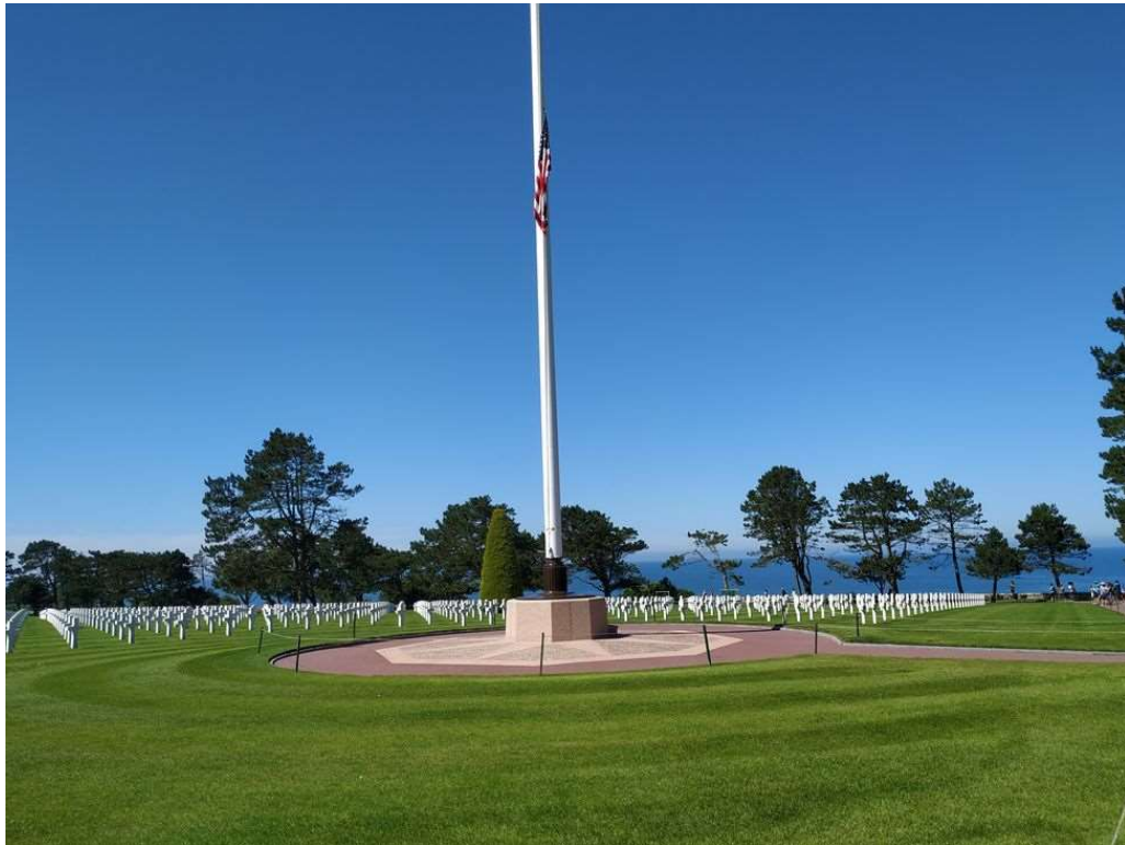
Amerikaans kerkhof in Colleville Sur Mer, Normandië. D Day juni 1944, vandaag is er nog steeds oorlog in Europa.

Al meer dan 30 jaar weerstaat deze vrouw de kracht van zon en zout en Middellandse stormen. En dat zal zo nog eeuwen doorgaan. Veel groeten vanuit 'ons' vakantiehuisje 43,36906° N, 6,71435° O