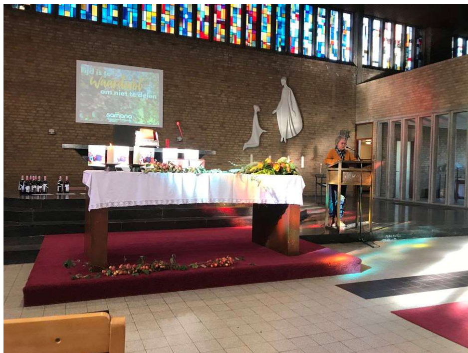
Het altaar is mooi versierd met takken met mini-appeltjes. Een echt herfstbeeld. Ze zijn gesnoeid in een tuin in Sint-Amandsberg. Hopelijk kunnen ze lang ons altaar sieren. De zon schijnt volop op het altaar en dan kleuren ze nog zo mooi.