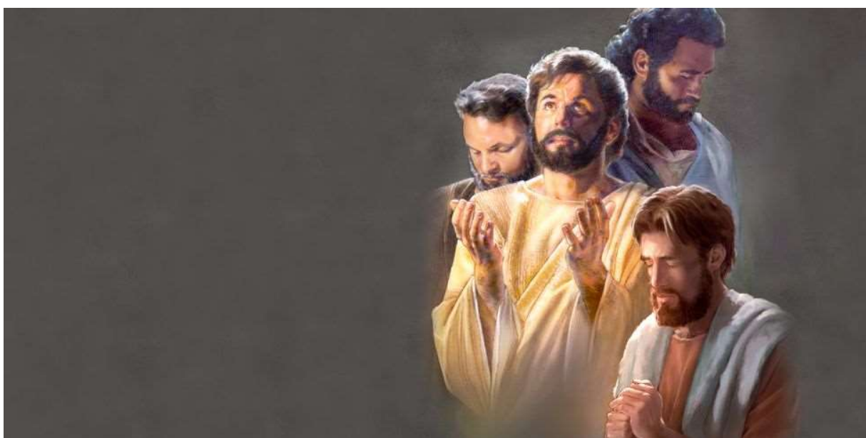
Jezus' slotgebed in de bovenkamer.

Ze zijn teruggekeerd naar Jeruzalem, ze zijn samen in de bovenzaal, ze blijven eensgezind volharden in gebed, de leerlingen samen met de vrouwen, met Maria, de moeder van Jezus, en met zijn broeders.