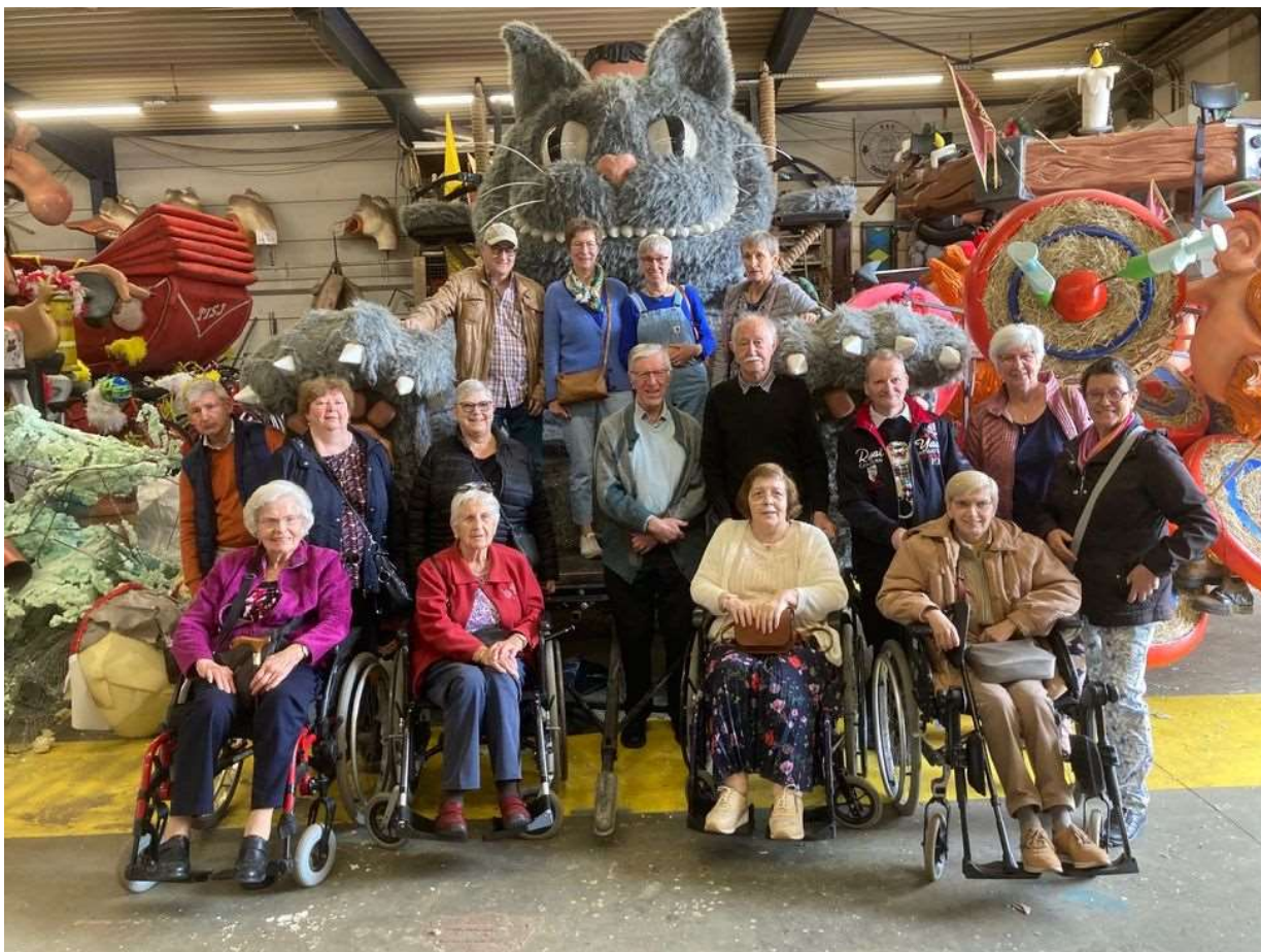
De leden van Samana Ziekenzorg bezoeken Aalst carnaval.