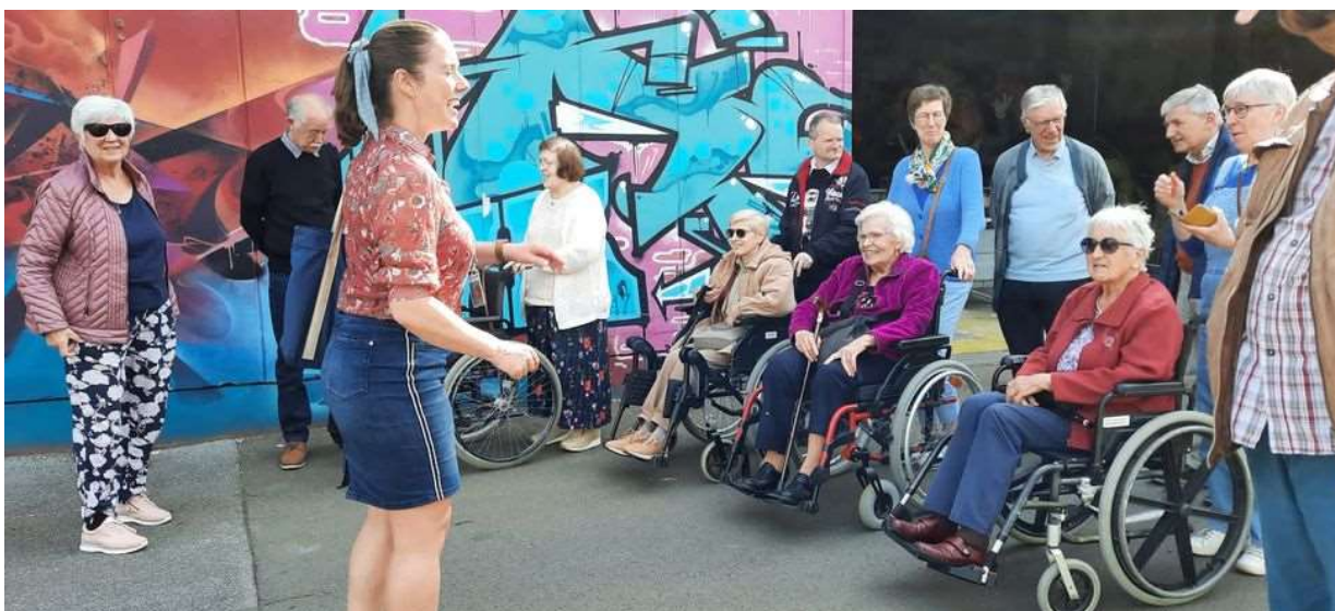
Met dank aan de gids kregen we heel wat info over de grote werken voor de voorbereiding van Aalst carnaval.