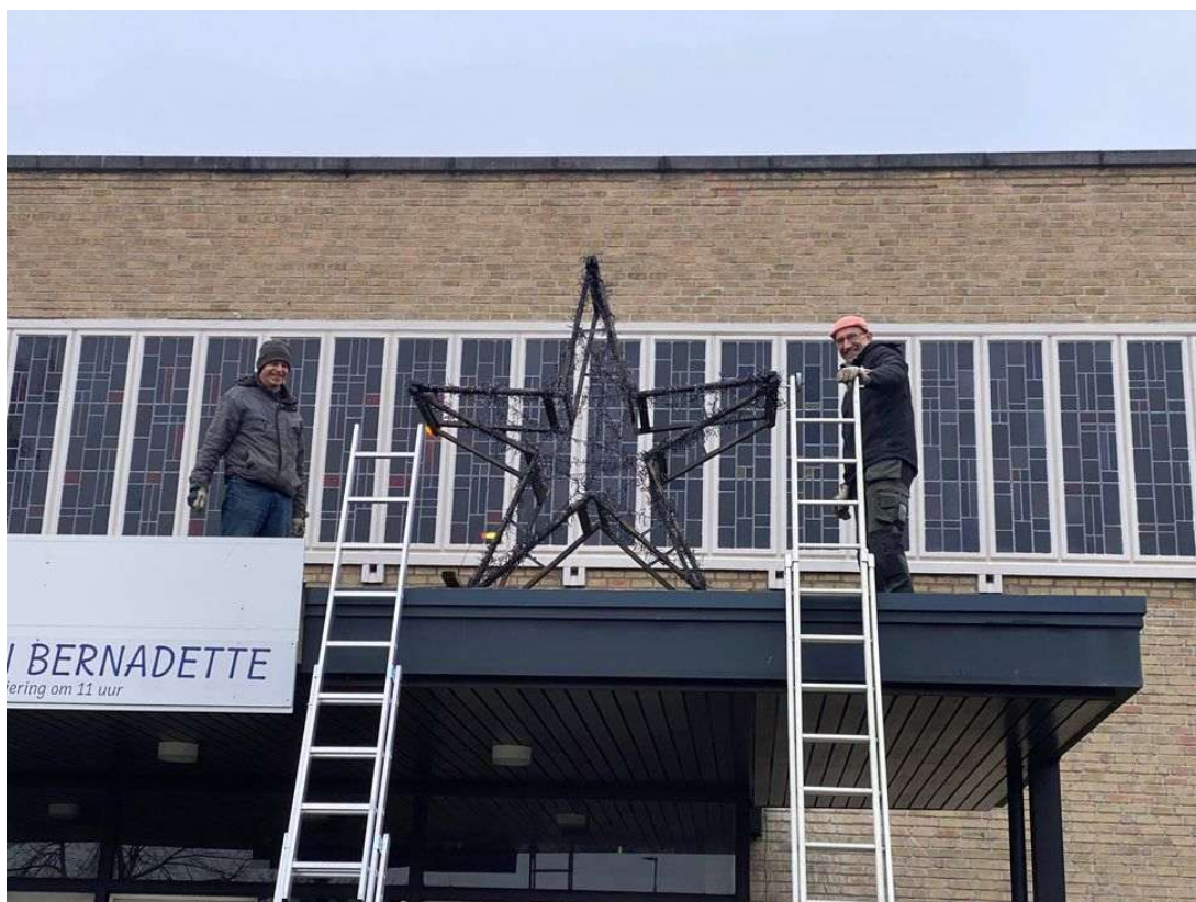
Twee leden van de kerkraad hebben de kerstster op de luifel van de kerk geplaatst.